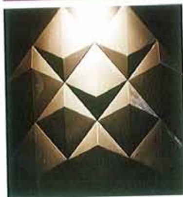
10 - « Peak » Entreprise Fauvel / Adrien De Melo