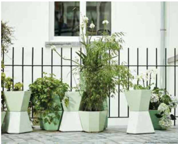
Fauvel Normandy Ceramics

à cette tendance green et detox. Le laiton doré apporte une touche de personnalité, tandis que le velours se fera plus trendy. Vous avez l'embarras du choix.