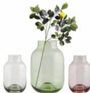
Love Creative People